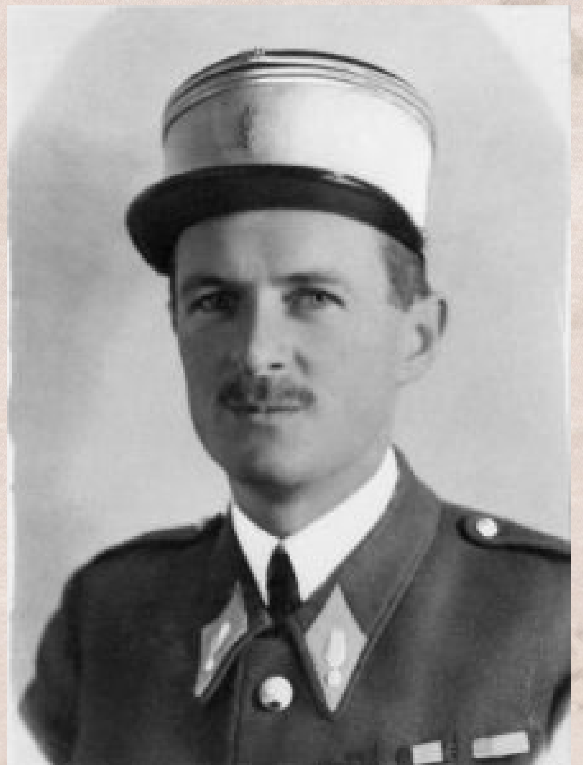
Le colonel LECLERC, dirigeant la 2ème DB