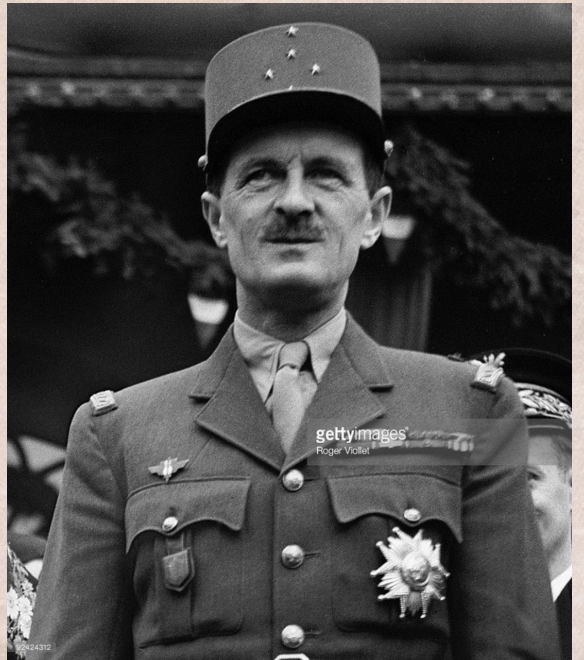
Le général LECLERC, général à 5 étoiles