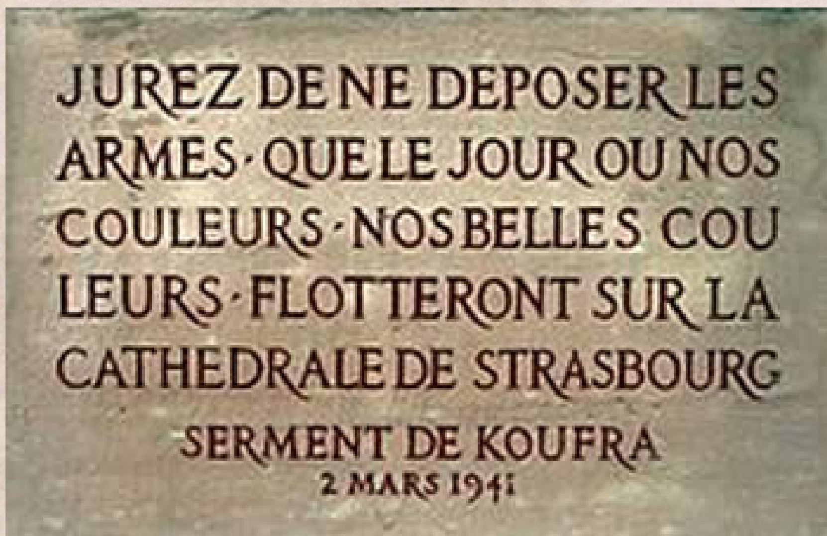
Plaque où a été gravé le Serment de Koufra